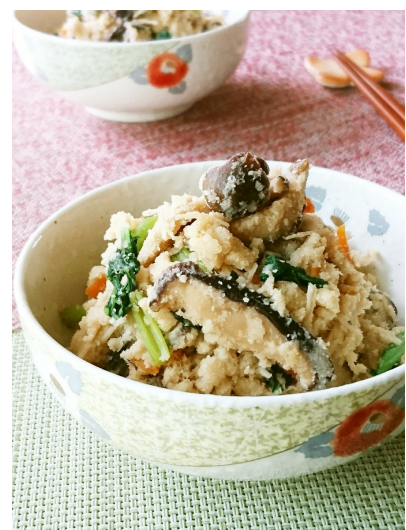
グランプリ受賞レシピ